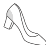
LÁMINA DE FIBRA TERMOFORMADA Y REFORZADA (POR SISTEMA DE INMERSIÓN) DE 1,2 mm DE ESPESOR. PIEZA EXTRA GAMUZADA DE 0,6 mm PARA MAYOR FIJACIÓN Y DURABILIDAD. ▾