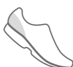
LÁMINA DE FIBRA TERMOFORMADA Y REFORZADA (POR SISTEMA DE INMERSIÓN) DE 2 mm DE ESPESOR. PIEZA EXTRA GAMUZADA DE 0,6 mm PARA MAYOR FIJACIÓN Y DURABILIDAD.