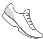
LÁMINA DE FIBRA TERMOFORMADA Y REFORZADA (POR SISTEMA DE INMERSIÓN) DE 2 mm DE ESPESOR. PIEZA EXTRA GAMUZADA DE 0,6 mm PARA MAYOR FIJACIÓN Y DURABILIDAD.